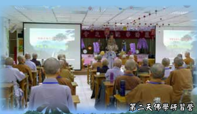
第二天佛學研習營