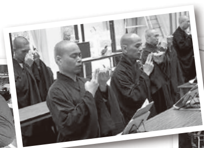
◀◀大悲懺院內共修法會