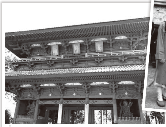
和歌山縣 - 「高野山」大門。

第二站住在大阪難波的民宿，參觀了神戶的六甲山、有馬溫泉老街、有馬玩具博物館、北野異人館，以及大